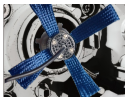
2- ABRA AS MANTAS TÉRMICAS (DISSIPADORES DE CALOR).