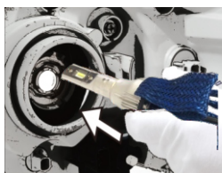
3- INSTALE O CONJUNTO DE LED