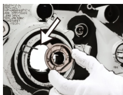
1- FIXE O SOQUETE NO FAROL